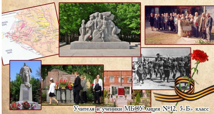
Учителя и ученики МБОУ лицея №12, 5«Б» класс

Сегодня в Краснодаре ещё есть живые участники освобождения города. Эти люди являются свидетелями тех славных и драматических событий.